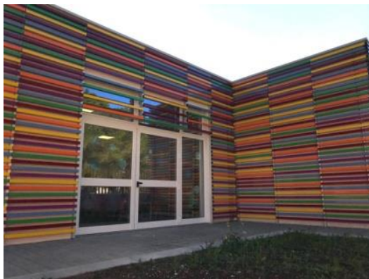
Plesso MATER CHRISTI Via delle Spinelle Castellaneta città