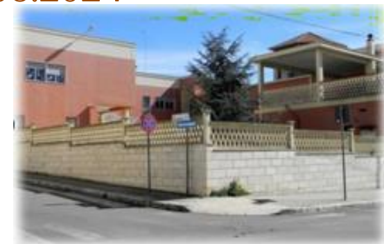
Plesso IACOBELLIS Via Iacobellis Castellaneta città