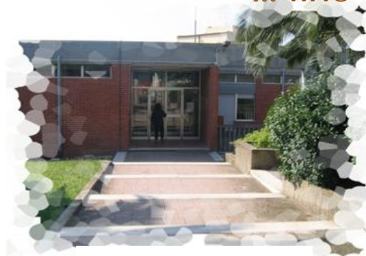
Plesso Spineto M. Via delle Spinelle Castellaneta città