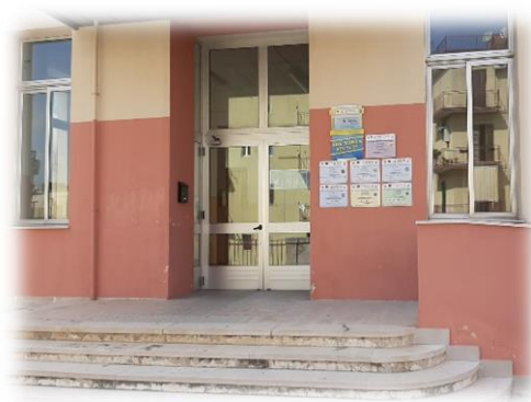
Plesso SURICO/PASCOLI SEDE UFFICI Via Mazzini, 23 Castellaneta città