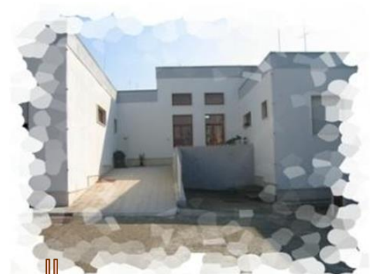
Plesso MATER CHRISTI Via delle Spinelle Castellaneta città