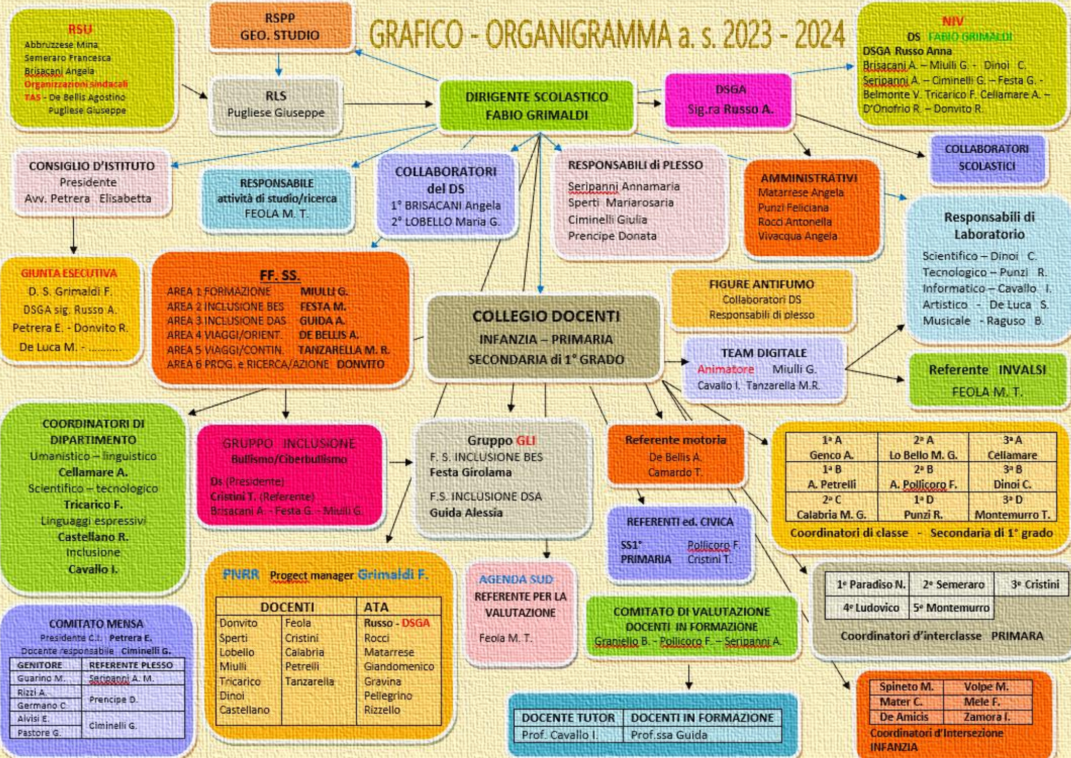
GRAFICO - ORGANIGRAMMA a. s. 2023 - 2024