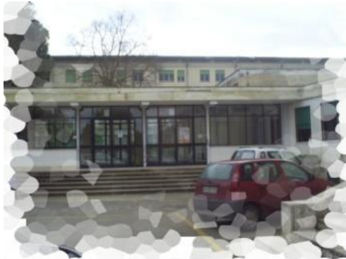
Plesso DE AMICIS Castellaneta M.

INGG. GEO. STUDIO RSPP Medico competente